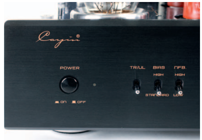
Eine sechsschichtige Lackierung verleiht dem Cayin seine edle Optik. Die Bedienelemente sind sehr hochwertig.

Schaltet man den Cayin ein, benötigt er etwa eine halbe Minute, bis er die Röhren vorgewärmt hat und den ersten Ton von sich gibt. Wir starteten mit meinem zweitliebsten Song von 2019 (nach Tools „Fear Inoculum“): „Kriegerin“ von den