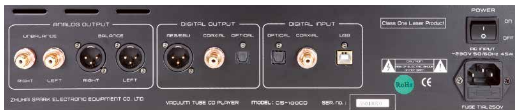
Auf seiner Rückseite präsentiert sich der nur vermeintlich puristisch gehaltene Player-DAC dank seiner Bit-Eingänge (r.) inklusive USB-Schnittstelle für PC oder Mac als vielfältig einsetzbare Digitalzentrale.

HMS Gran Finale Jubilee und Suprema (NF+LS), Mudra Akustik (Netz)