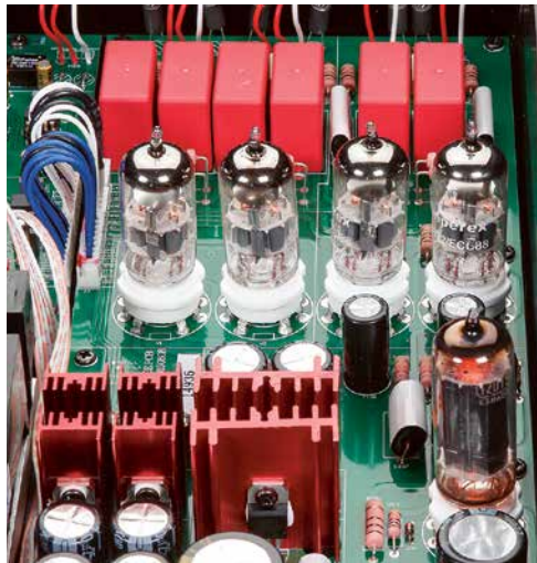
Die Stabilisierung der Hochspannung für die Anoden der vier Ausgangstrioden erfolgt ebenfalls per Röhre (r.) in unmittelbarer Nähe.

zugleich tadellos verarbeitetes 12-Kilo-Gerät, das gehörigen Aufwand, clevere Lösungen plus obendrein ein „Extrabonbon“ für den Röhrenliebhaber in sich vereint.