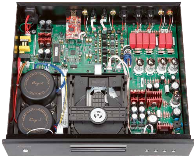
Das gut gefüllte Innenleben des Cayin wird von zwei gekapselten Trafos (l.) nach digitalen und analogen Funktionsgruppen getrennt versorgt.